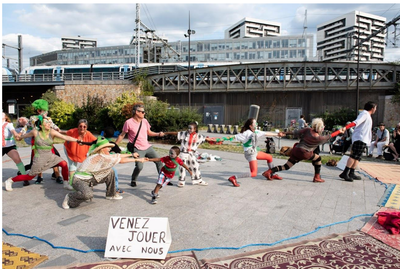
La beauté de l'humanité, version augmentée, 17 juillet 2024, esplanade Rosa Parks, Paris 19ème Projet soutenu par la Préfecture de Paris et la Ville de Paris

Nous pouvons réfléchir à la construction et la présentation d'une version augmentée de notre Beauté de l'humanité sur un territoire, pour une structure ou pour un groupe constitué !